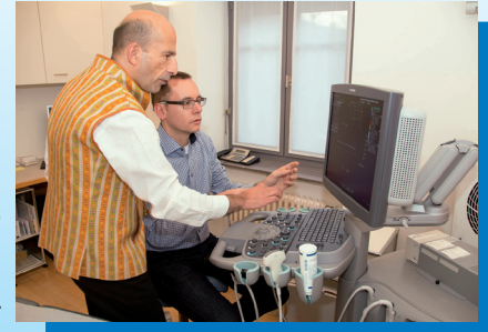
Komplexe Fälle werden gemeinsam diskutiert